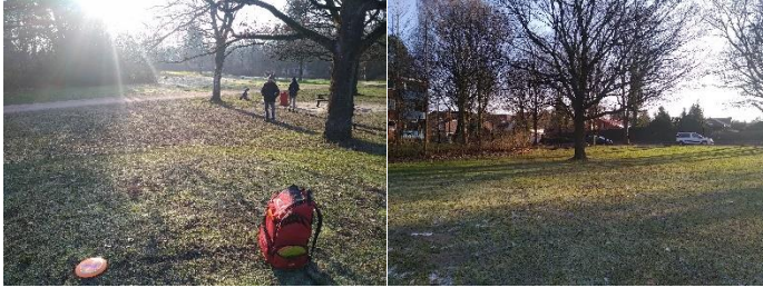
Abwurf ( hier blockiert ), Zielbaum

Abwurf auf dem kleinen Hügel bei der Weggabelung vor dem Spielplatz, Ziel ist der Stamm bis 2m Höhe des einzeln stehenden Baumes (Linde) auf der großen Wiese hinten links, also etwa beim Abwurf von Bahn 1. Achtung auf Passanten auf den Wegen. Achtung auf Passanten auf den Wegen und Wiesen.